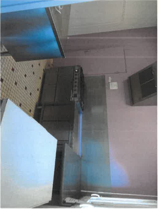
CUISINE (ESPACE RESTAURATION)